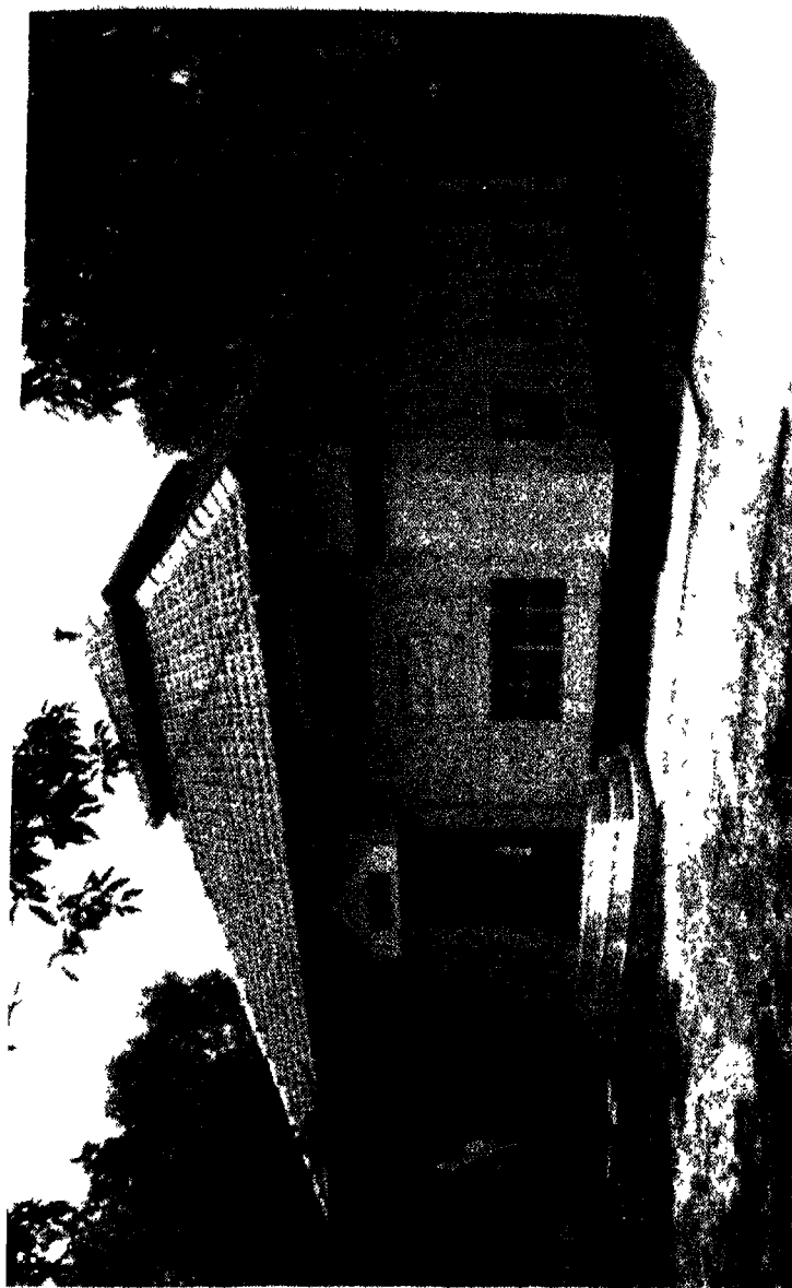
(उपाध्याय यशोविजयस्मृति मन्दिर की भव्य इमारत)